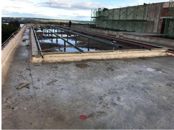
07 – Regularização de piso da cobertura e reboco.