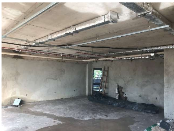
15 – Calhas de iluminação, tubulações de águas pluviais e ar condicionado.