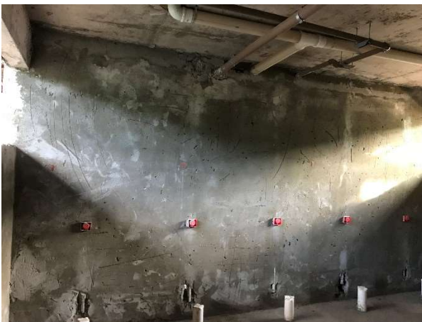
09 – Regularização de pisos e paredes de banheiros.