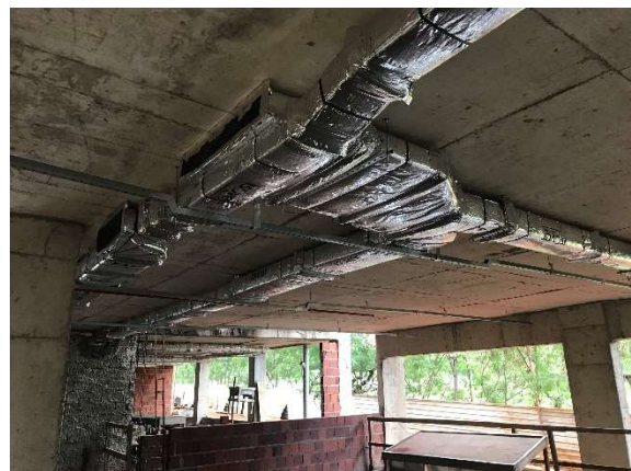
12 – Dutos de renovação de ar (sistema de ar condicionado).