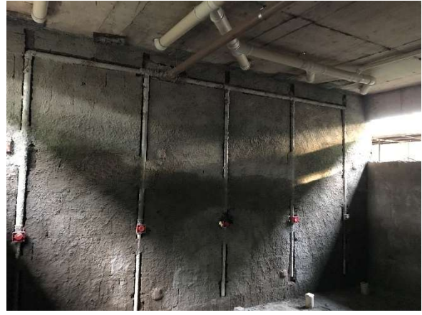
08 – Chapisco e tubulação de banheiros.