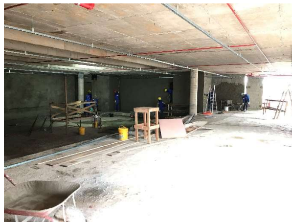
10 – Execução de massa única em paredes.