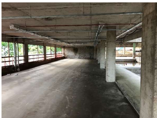
03 – Regularização de piso térreo.