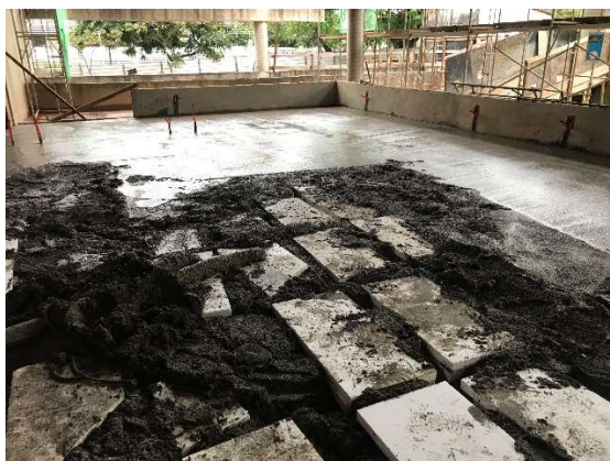
13 – Regularização piso, com enchimento de isopor.