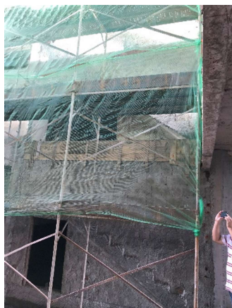
01 – Estrutura de escadas, chapisco.