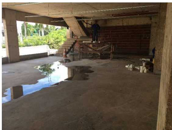
16 – Execução de tubulações de esgoto.