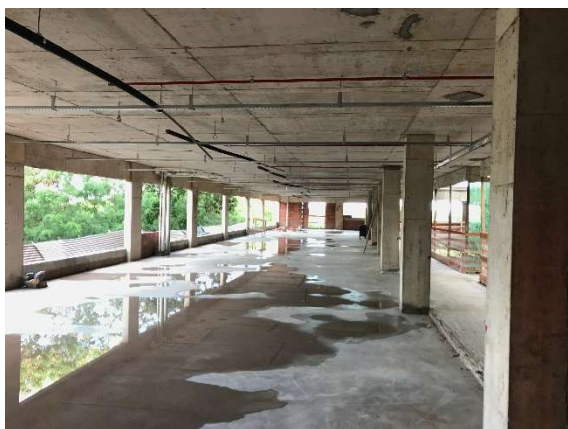
05 – Regularização de piso 1º andar, calhas de iluminação.