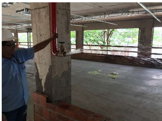
17 – Teste de tubulação de hidrante.