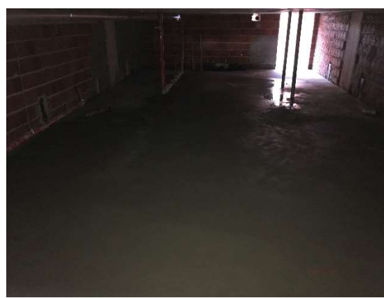
06 – Barrilete, regularização de piso, tubulação.