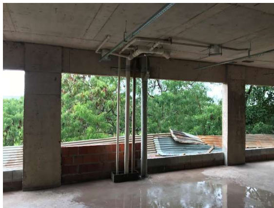
14 – Instalações de esgoto sanitário.