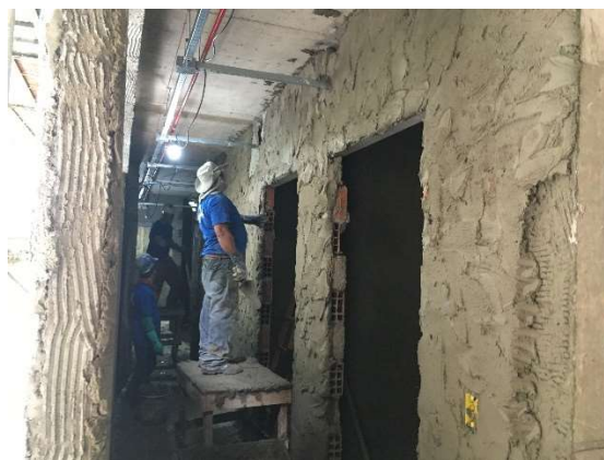
18 – Execução de massa única.