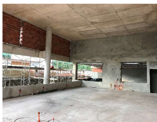
04 – Hall de entrada, regularização e piso, alvenaria.