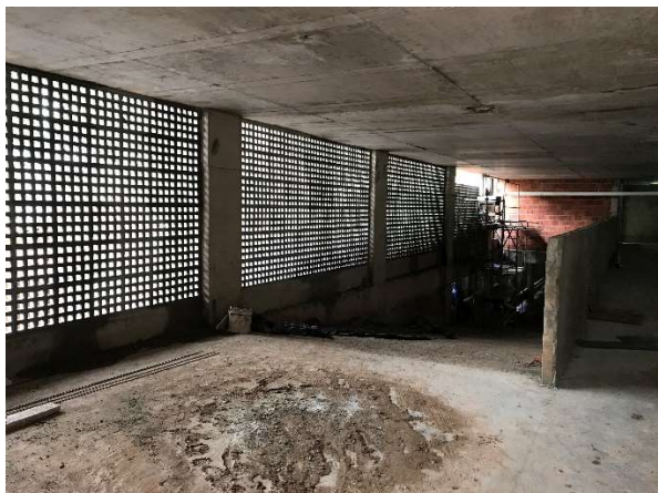
11 – Elemento vazado “cobogó” 1º subsolo.